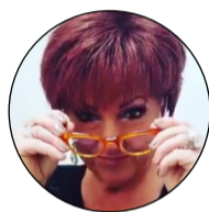
Orietta Berti E' stata lei a lanciare la moda in tv.