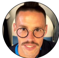
Marek Hamsik Il capitano del Napoli.