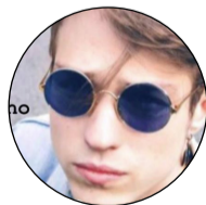
Irama L'ultimo vincitore di "Amici"